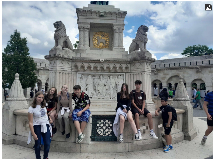
A GALÉRIA 13 KÉPET TARTALMAZ

A Móra Ferenc Iskoláért és Diákjaiért Alapítvány vissza nem térítendő támogatásban részesült a „Tehetségközelben” – komplex tehetséggondozó programok támogatása” pályázati konstrukció keretén belül. A támogatott program azonosító száma NTP-TEHETSEG-23-0022, a támogatás mértéke 2.175.000 Ft.